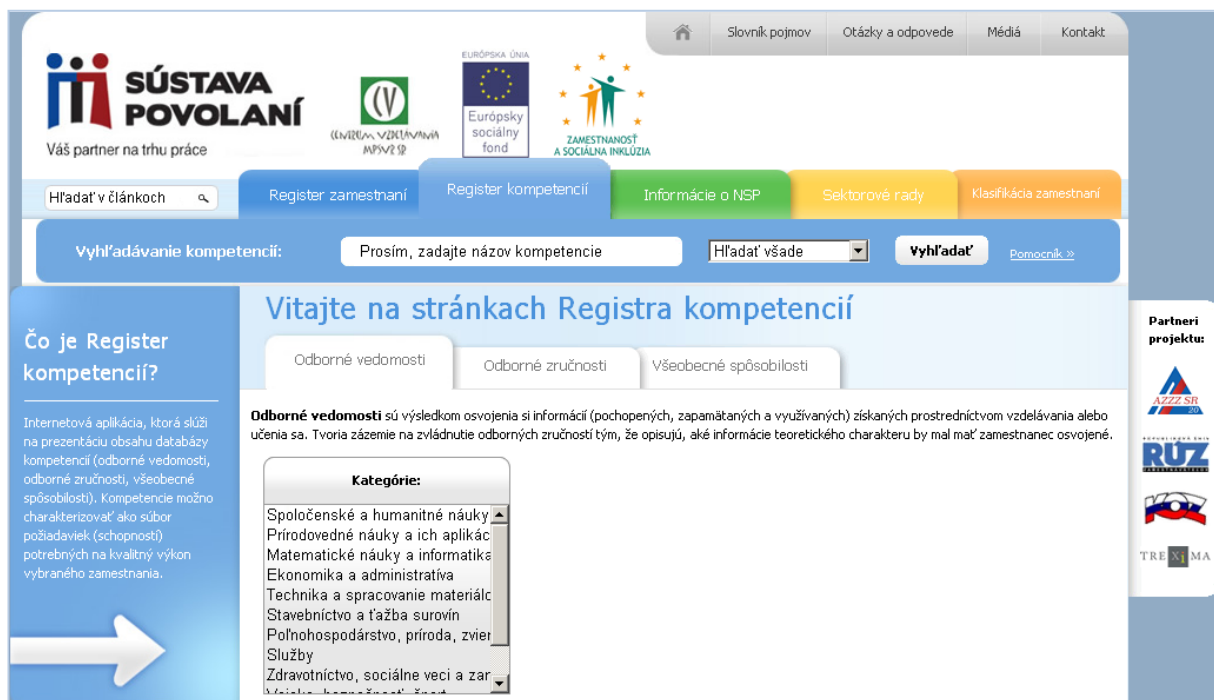
Obrázok č. 5: Domovská stránka Registra kompetencií